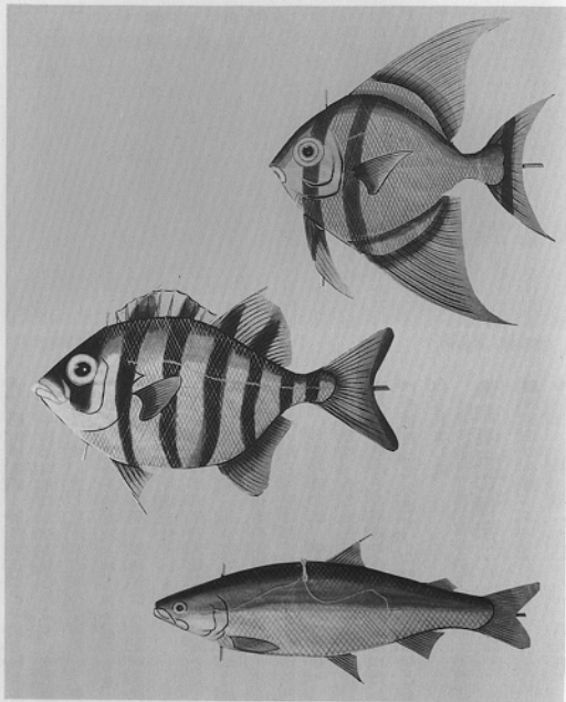
焼津魚風 (上よりリツバメ魚、イシダイ、鮭)