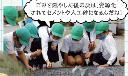
ごみを燃やした後の灰は、資源化されてセメントや人工砂になるんだね!