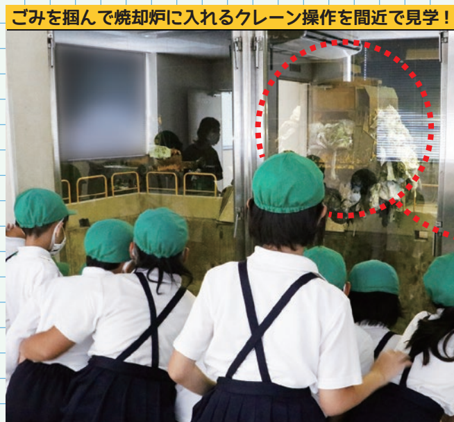
ごみを掴んで焼却炉に入れるクレーン操作を間近で見学!