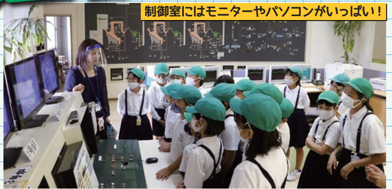
制御室にはモニターやパソコンがいっぱい!