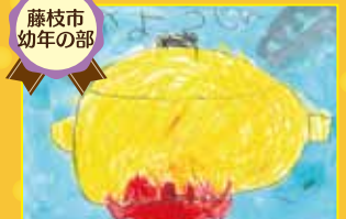
消防団長賞 ガゼルの森 矢元優羽