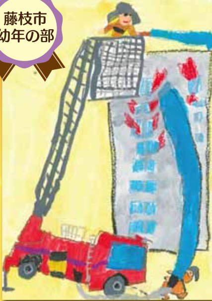
県コンクール佳作 藤枝市長賞 岡部あさひな保育園 池田大和