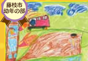
消防団長賞 岡部みわ保育園 四野見莉愛