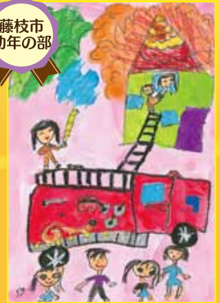
藤枝市長賞 藤枝橋幼稚園 有ヶ谷風羽