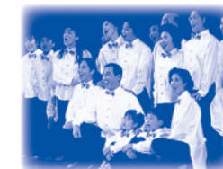
平成4年3月 第1回 志太のミュージカル上演