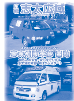
平成25年3月 志太消防本部発足当時の 広報号外