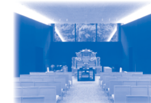
令和元年9月 葬祭式場供用開始