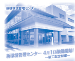
令和3年4月 新環境管理センター供用 開始時の広報特集