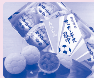
Ⓑサッカーエース最中 (10名様)