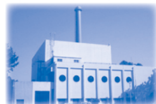
昭和49年3月 一色清掃工場完成

昭和47年6月、焼津市・藤枝市・大井川町・岡部町の二市二町が、自治体共通の課題である環境衛生施設整備事業の効率的な管理運営を図る目的で、「志太二市二町環境整備組合（現；志太広域事務組合）」を設立しました。設立当初は、ごみ処理施設を建設し、管理運営を行っていましたが、斎場事業・し尿処理事業・看護学校運営など徐々に共同事業を拡大。平成25年には、焼津市・藤枝市の消防本部が一つになり、志太消防本部が発足しました。現在は、ごみ処理施設の老朽化に伴い（仮称）クリーンセンターの建設を進めるなど、地域の皆様の安全・安心な生活を守り、より豊かで住みよい地域社会の実現に向けて事業に取り組んでいます。