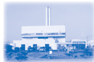
昭和59年3月 高柳清掃工場完成