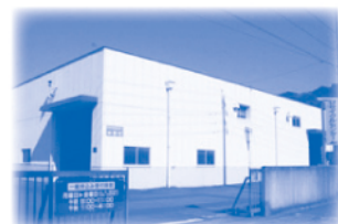
昭和53年8月 岡部リサイクルセンター完成