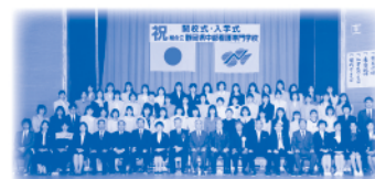
平成2年4月 中部看護専門学校開校式

昭和47年6月 焼津市、藤枝市、大井川町、岡部町による 志太二市二町環境整備組合（一部事務組合）を設立