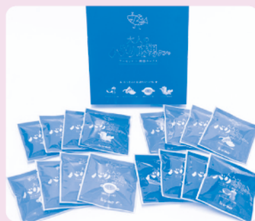
Ⓐ大人のバリ勝男クン。 (10名様)

正解者の中から抽選で合計20名様に、次の品物をプレゼント! ※プレゼントは都合により変更する場合がございます。