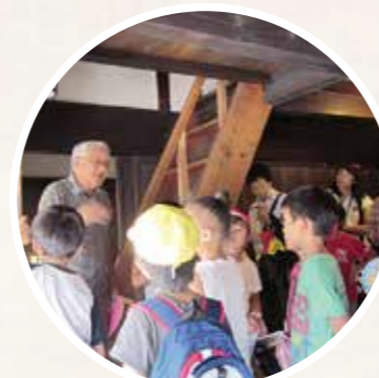
志太子どもふるさと巡り