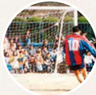
第1回全国PK選手権大会