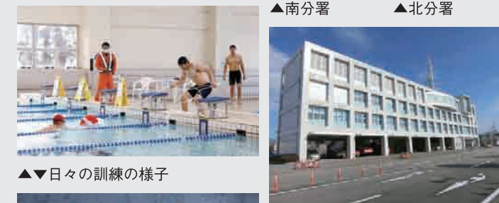
▲▼日々の訓練の様子 ▲南分署 ▲北分署