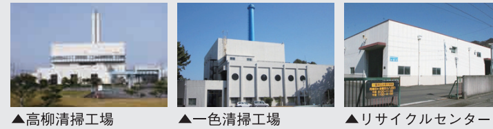
▲高柳清掃工場 ▲一色清掃工場 ▲リサイクルセンター

リサイクルセンター：藤枝市岡部町内谷833番地の2 TEL 054-667-2626