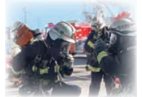
平成 25 年 3 月 志太消防本部発足