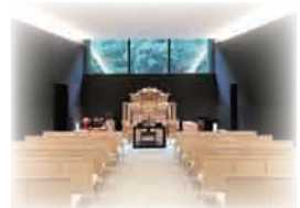
令和元年 9 月 斎場会館葬祭式場供用開始