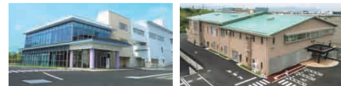
▲藤枝環境管理センター ▲大井川環境管理センター

クリーンセンター整備課：藤枝市岡部町岡部6番地の1 TEL 054-637-9501