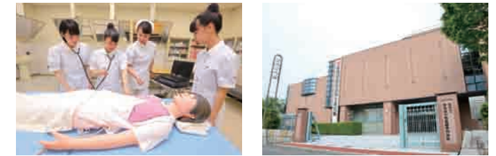
▲日々切磋琢磨しながら、勉学や臨地実習に励む学生たち ▲さまざまな設備を備え、高度な臨地実習にも対応しています