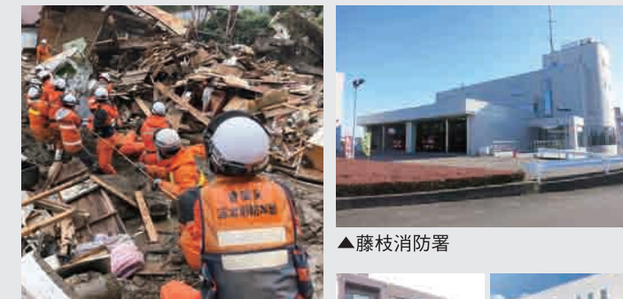
▲熱海の災害現場で活動する志太消防本部の隊員（令和3年7月） ▲藤枝消防署