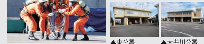
▲焼津消防署 ▲東分署 ▲大井川分署