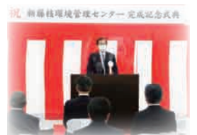
令和 3 年 3 月 藤枝環境管理センター 完成記念式典