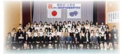
平成 2 年 4 月 中部看護専門学校開校式