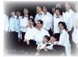
平成 4 年 3 月 第 1 回志太のミュージカル上演