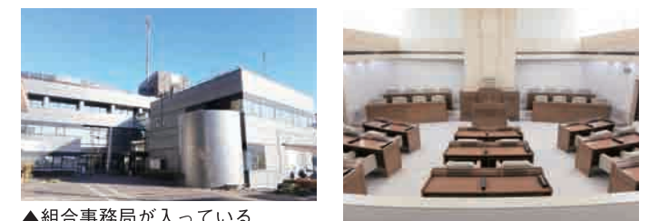
▲組合事務局が入っている藤枝市岡部支所 ▲組合議会が行われる議場